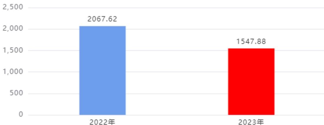
一般公共预算财政拨款支出决算变动情况图（单位：万元）

2023年度一般公共预算财政拨款支出1,547.88万元，占本年支出合计的100%。与2022年度相比，一般公共预算财政拨款支出减少519.74万元，下降25.14%，主要是：2022年完成市公共信用服务展示中心项目投资计划，2023年无基建项目投资计划。