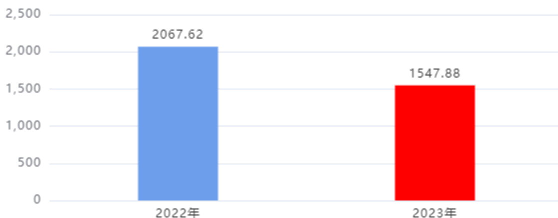
财政拨款收、支决算总计变动情况图（单位：万元）

2023年度财政拨款收、支总计1,547.88万元。与2022年度相比，财政拨款收、支总计各减少519.74万元，下降25.14%，主要是：2022年完成市公共信用服务展示中心项目投资计划，2023年无基建项目投资计划。