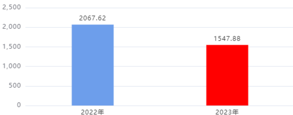
收、支决算总计变动情况图（单位：万元）

2023年度收、支总计1,547.88万元。与2022年度相比，收、支总计各减少519.74万元，下降25.14%，主要原因是：2022年完成市公共信用服务展示中心项目投资计划，2023年无基建项目投资计划。