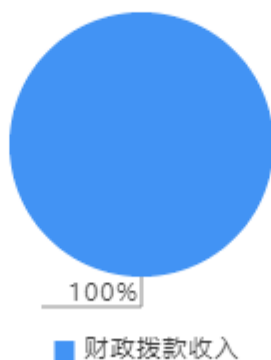
本年收入决算结构图

本年收入合计1,547.88万元，其中：财政拨款收入1,547.88万元，占100%。