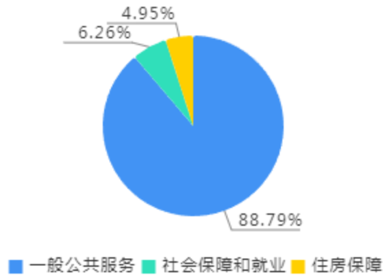
一般公共预算财政拨款支出决算结构图