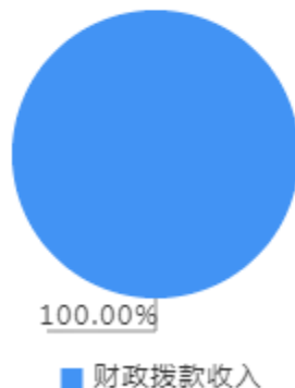
本年收入决算结构图

本年收入合计2,067.62万元，其中：财政拨款收入2,067.62万元，占100.00%。