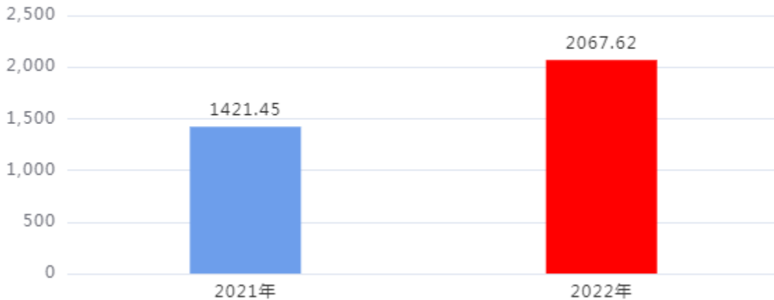
收、支决算总计变动情况图（单位：万元）

2022年度收、支总计2,067.62万元。与2021年度相比，收、支总计各增加646.17万元，增长45.46%。主要是人员经费和市公共信用服务展示中心项目增加。