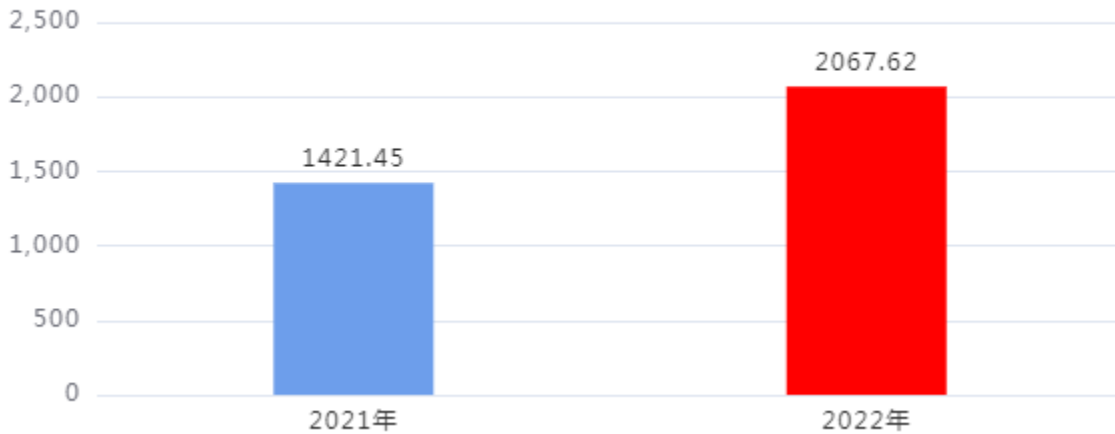
财政拨款收、支决算总计变动情况图（单位：万元）

2022年度财政拨款收、支总计2,067.62万元。与2021年度相比，财政拨款收、支总计各增加646.17万元，增长45.46%。主要是人员经费和建设市公共信用服务展示中心项目增加。