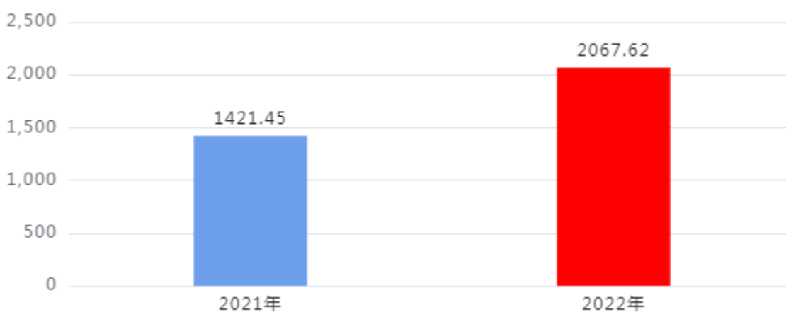
一般公共预算财政拨款支出决算变动情况图（单位：万元）

2022年度一般公共预算财政拨款支出2,067.62万元，占本年支出合计的100.00%。与2021年度相比，一般公共预算财政拨款支出增加646.17万元，增长45.46%。主要是人员经费和建设市公共信用服务展示中心项目增加。